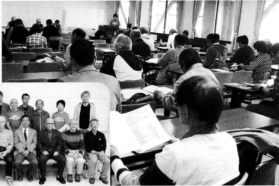
総会会場(県スポーツ会館)と新役員・常任理事のみなさん

◆7月9日(火) 気象遭難対策講習会(県スポーツ会館) http://www.geocities.co.jp/Athlete/1653/