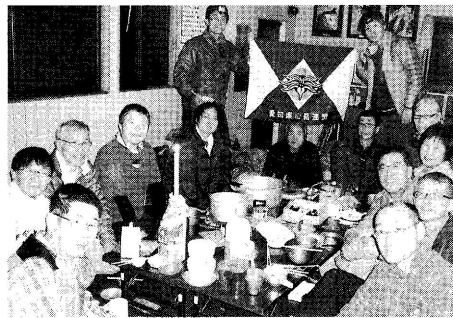
いて激論が交わされ盛り上がった。